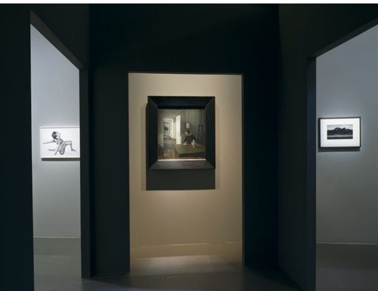
MARC DOMERGE/LA MAISON ROUGE